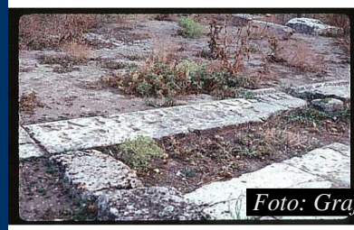
Foto: Graf van Erastus

Vanaf Hand. 20 sluit Lukas zich aan bij Paulus (“wij” ipv “zij”)